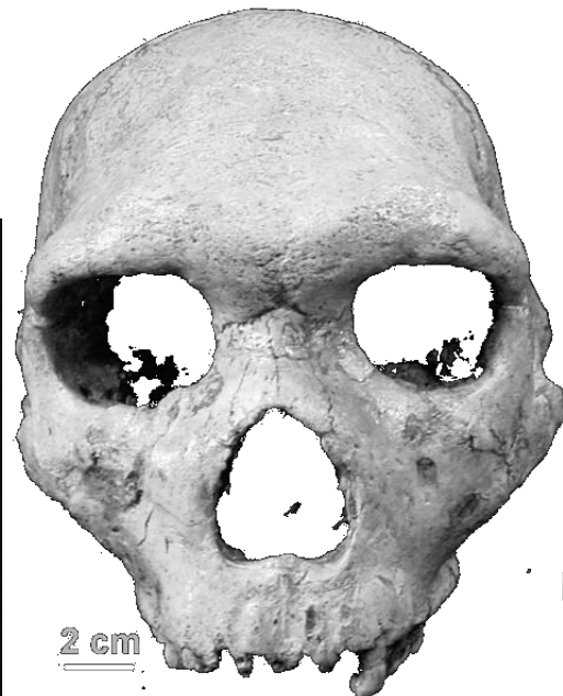
Ανθρωπος των Πετραλώνων